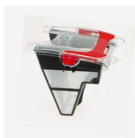
Bac filtrant (3 L) facile d'accès