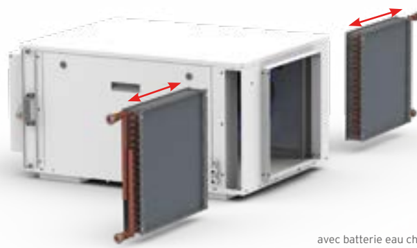
avec batterie eau chaude