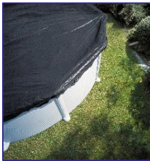
CIPROV731 Cubierta de Invierno Copertura invernale