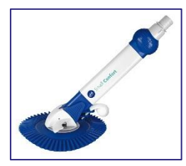
Limpiafondos automáticos Puliscifondo automatici