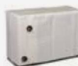
Capa de hibernação