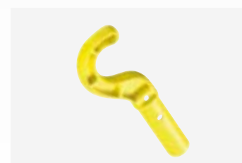
Crochet universel d'aide à la sortie de l'eau

Un robot sans fil électrique doté d'une batterie lithium-ion permet un nettoyage autonome de votre piscine sans besoin de le brancher au système de filtration ou à une prise électrique. Il brosse et récupère les débris dans son propre bac filtrant.