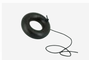
Anneau flottant d'aide à la sortie de l'eau