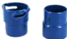
Adaptateurs tuyaux standards et twist lock