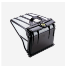
Filterbak (5 liter) Stevig, zeer fijn filter met grote inhoud