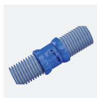
Tuyaux Twist Lock