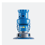
Régulateur de débit (robot)