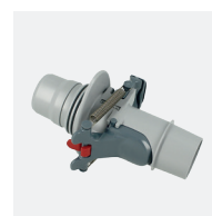
Vanne de réglage automatique de débit (skimmer)