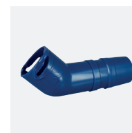
Coude 45° allongé rotatif