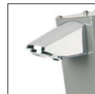
ROCIADOR SHOWER HEAD