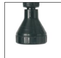
ROCIADOR SHOWER HEAD