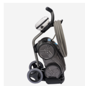
Carro de transporte

de grande capacidade (5 L) fácil de limpar