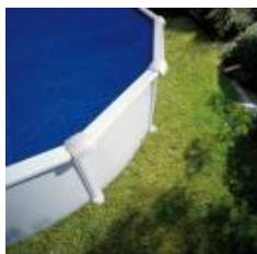
Isothermische Abdeckplane Isothermic cover CV300