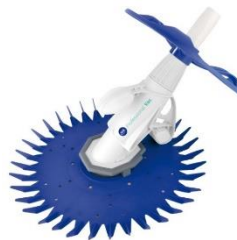
Automatischer Bodenreiniger Automatic cleaner 19007