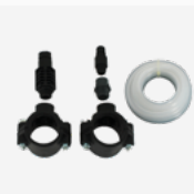
Kit installation tuyauterie