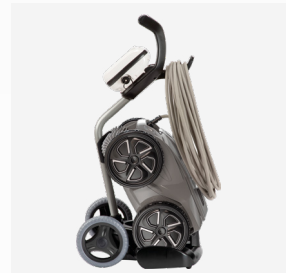
Carro de transporte