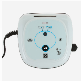
Unidad de control