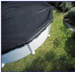
CIPR241 Cubierta de Invierno Copertura invernale