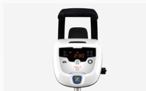
Quadro di comando