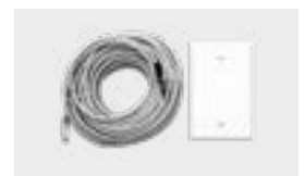
Set für Fernsteuerung