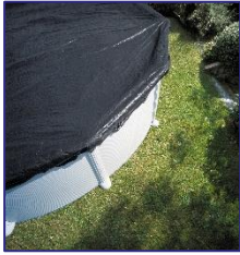
CIPR301 Couverture d'hiver Winterafdekking