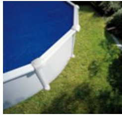
CV300 Couverture isotherme Isothermische afdekking