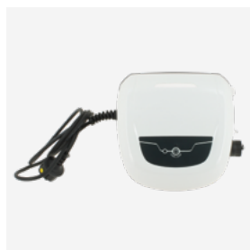
Caixa de comando