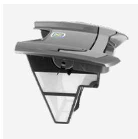
Filtro (3L) de fácil acesso