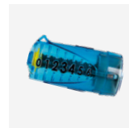
Tester di portata