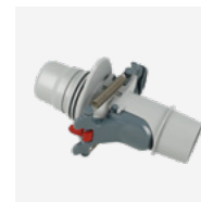
Valvola di regolazione automatica della portata