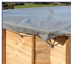
CIKPBOC632 Couverture d'hiver Winterafdekking