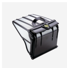
Filterbak (5 liter) Stevig, zeer fijn filter met grote inhoud