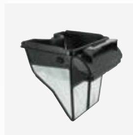
Bac filtrant de 100 µ