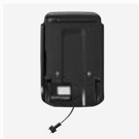
Station de charge et de rangement