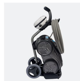
Chariot de transport

Facile d'accès et de grande capacité (5 litres)