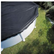
Cubierta de invierno Winter cover CIPR451