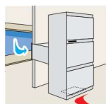
1 Rejilla + Reductor de ruido