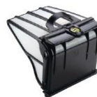
Filtro de residuos finos 100µ Fine Filter canister 100µ