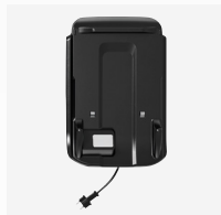
Station de charge et de rangement