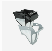
Bac filtrant Filtre double niveau : 150/60 µ