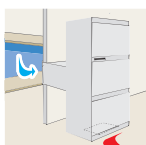
1 Grelha + Redutor de ruído