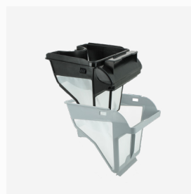
Bac filtrant Filtre double niveau : 150/60 µ