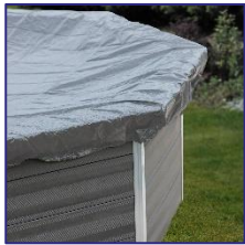
CIKPCOR60 Couverture d'hiver Winterafdekking