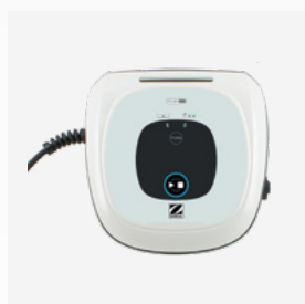
Boîtier de commande