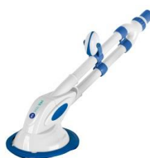
Limpiafondos automático Automatic cleaner 90399