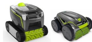
Robot Robot GT3220/GV3420