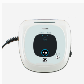
Scatola di comando