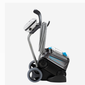
Carrello di trasporto