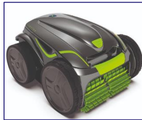
Robots Robots GT3220/GV3420