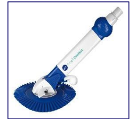
Automatische Boden Reiniger Automatic cleaner 90397