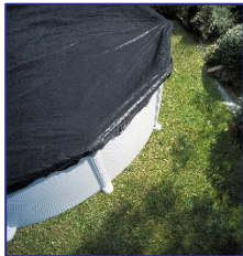
CIPR451/CIPR451P Cubierta de Invierno Copertura invernale