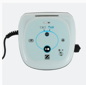
Unidad de control