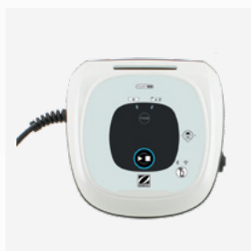
Scatola di comando