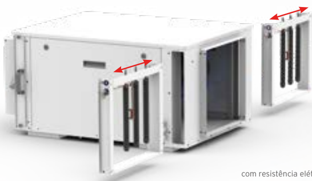
com resistência elétrica

Instalados diretamente na central de desumidificação, não ocupam qualquer espaço suplementar e são fáceis de instalar, bastando deslizá-los nos locais previstos.