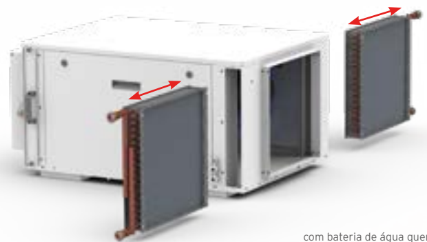
com bateria de água quente