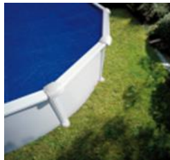
CV300 Couverture isotherme Isothermische afdekking