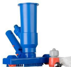
Limpiafondos Ventury Ventury vacuum 90111