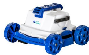
Robot Robot RKJ14