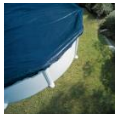
Cubierta de invierno Winter cover