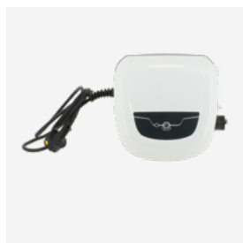
Caixa de comando