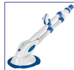
Nettoyeurs automatiques Automatische zwembadreiniger