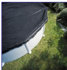
CIPROV611 Bâche d'hiver Winterafdekking