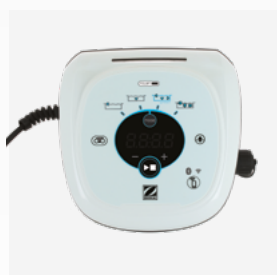
Boîtier de commande