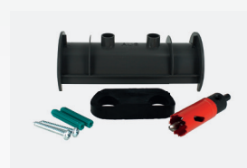
Kit d'installation de la cellule pour tuyaux de 50 et 63 mm