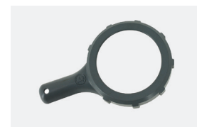
Clé desserrage cellule