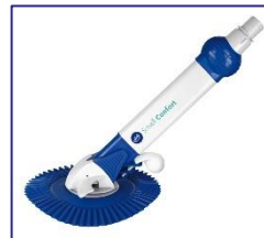
Automatischer Bodenreiniger Automatic cleaner