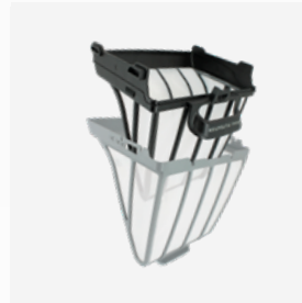
Hoofdfilter 150µ voor dubbele filtering of alleenstaand gebruik