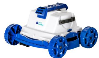
Roboter Robot RKJ14