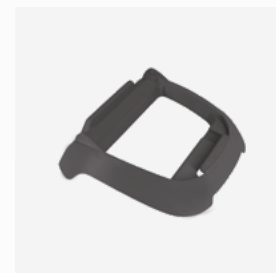
Sockel für die Steuerbox