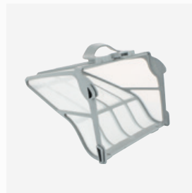
Filterbak 400 μ Filtering afgestemd op natuurlijke en biologische zwembaden van 400 microns