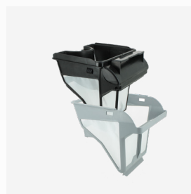
Filterbak Dubbel filter: 150/60 µ